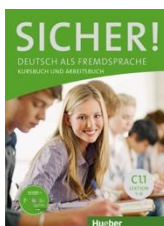
Sicher! C1.1 Kurs- und Arbeitsbuch