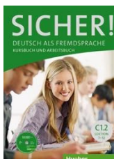
Sicher! C1.2 Kurs- und Arbeitsbuch