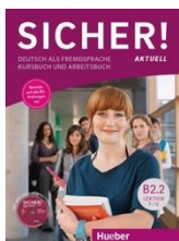
Sicher! Aktuell B2.2 Kurs- und Arbeitsbuch