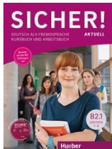
Sicher! Aktuell B2.1 Kurs- und Arbeitsbuch

Wir empfehlen die Plattform Hueber Interaktiv We recommend the platform Hueber Interaktiv